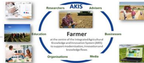
The structure of AKIS